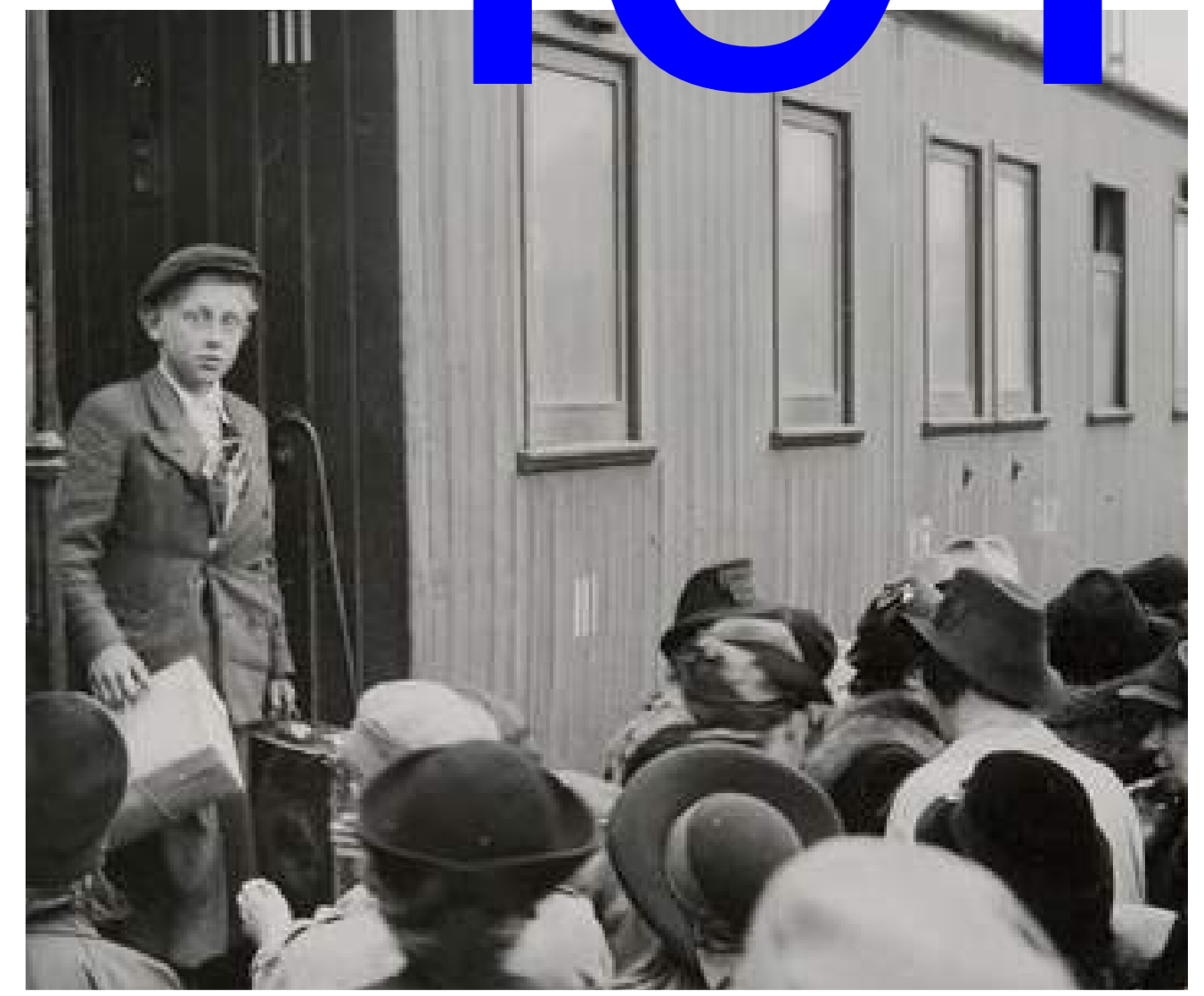
1943 Lapsia lähetetään maaseudulle turvaan mahdollisilta pommituksilta, kuvaaja F. E. Fremling, Museoviraston kuvakokoelmat, Historian kuvakokoelma.