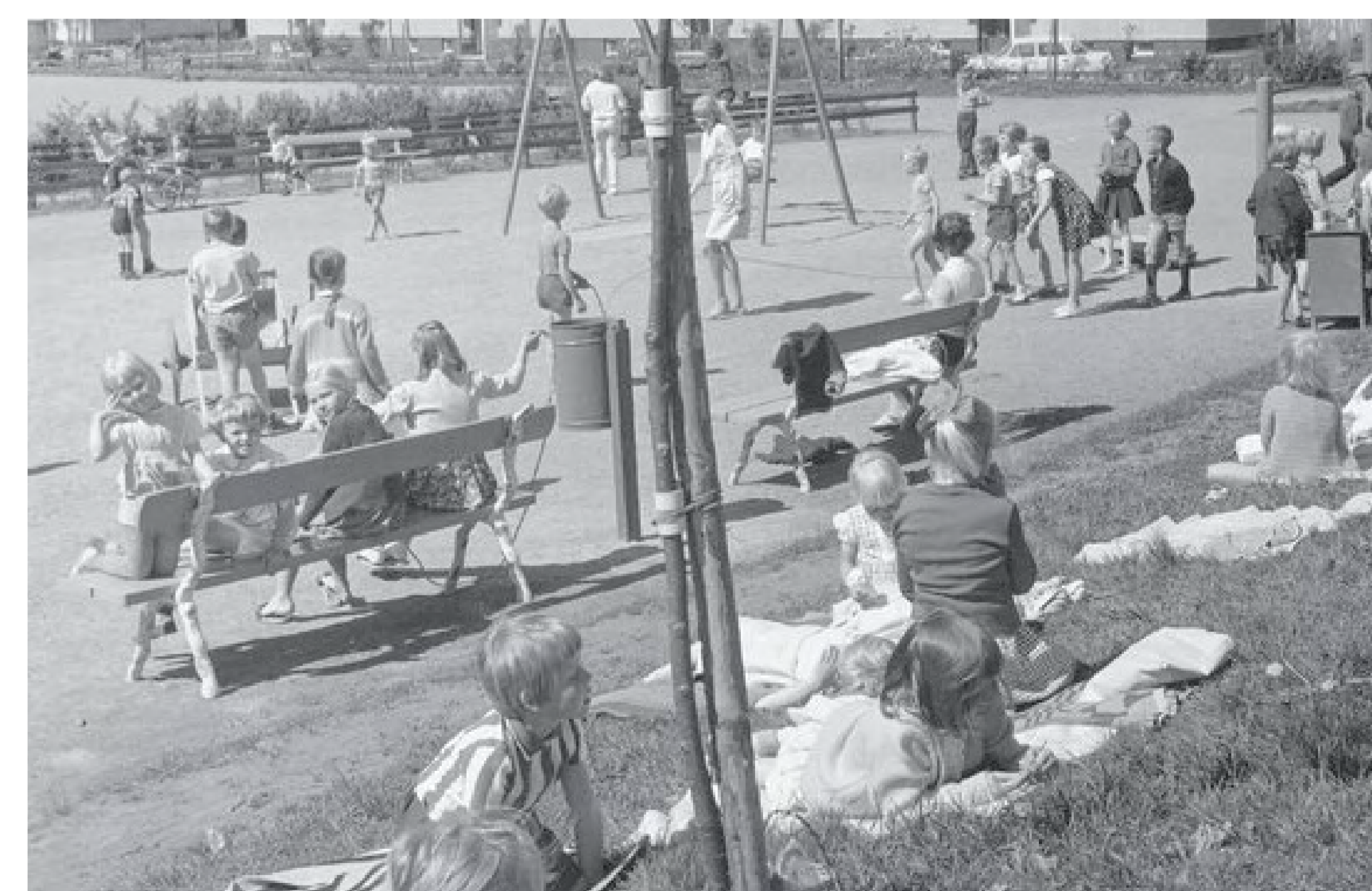
1966 Lapsia leikkipuistossa Puotilassa, kuvaaja Teuvo Kanerva, Museoviraston kuvakokoelmat, Historian kuvakokoelma.

1980 Vuoden 1925 ottolapsilaki kumottiin ja tilalle säädettiin uusi laki lapseksiottamisesta, jossa ottolapsi asetettiin täysin samaan asemaan kuin biologiset lapset.