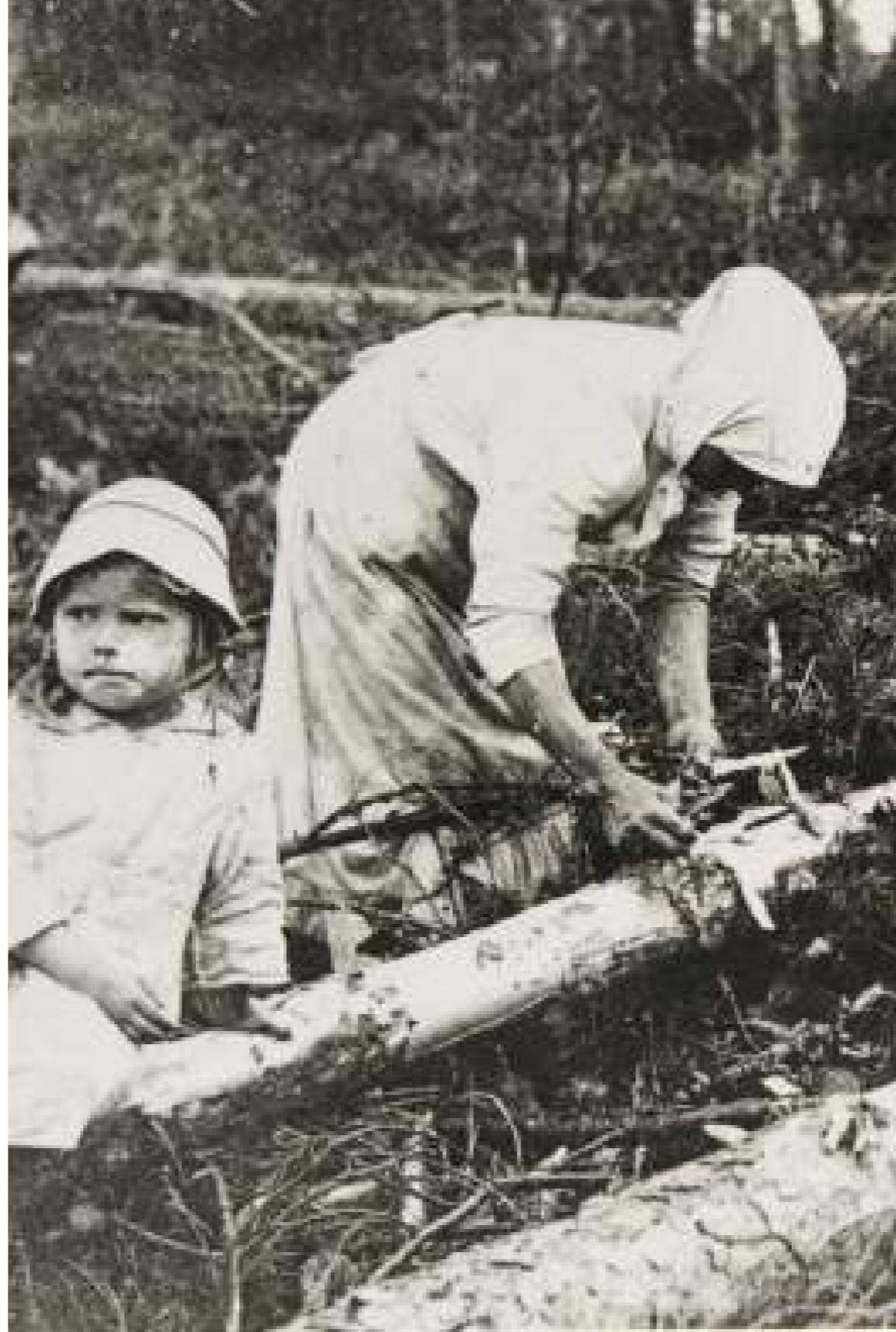
Savolaisperhe kuorimassa pettua vuoden 1918 sodan jälkeisenä pula-aikana, Museoviraston kuvakokoelmat, Historian kuvakokoelma.