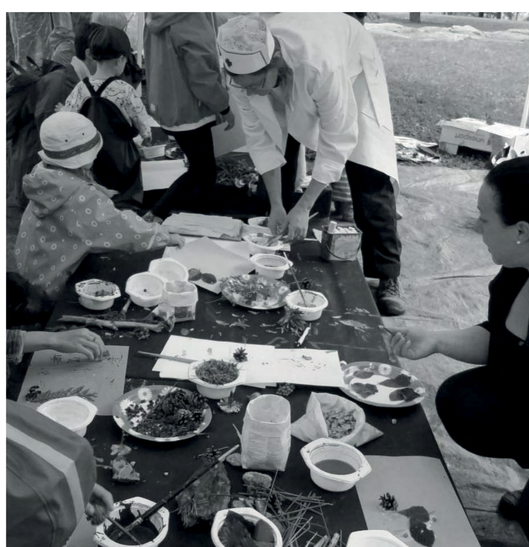
17.8.2017 Perheiden Taiteiden yö

1989 YK hyväksyi Lapsen oikeuksien sopimuksen.