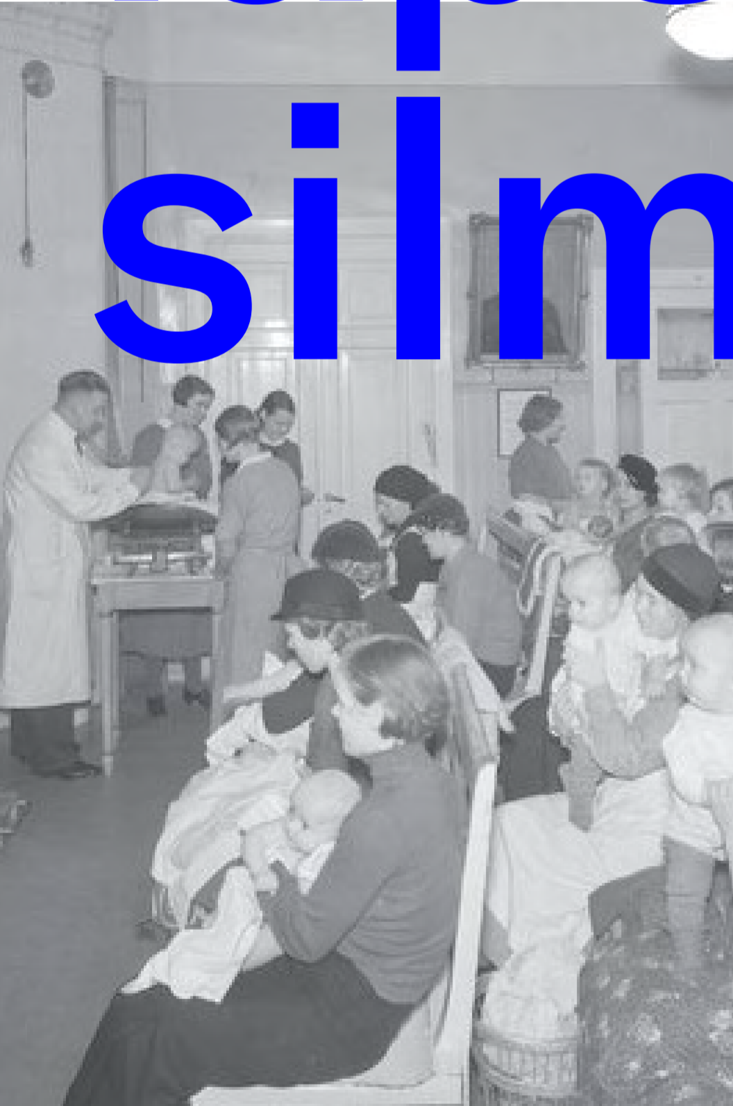
1936 Neuvolapäivä Helsingin Lastensairaalaassa, kuvaaja Pietinen, Museoviraston kuvakokoelmat, Historian kuvakokoelma.