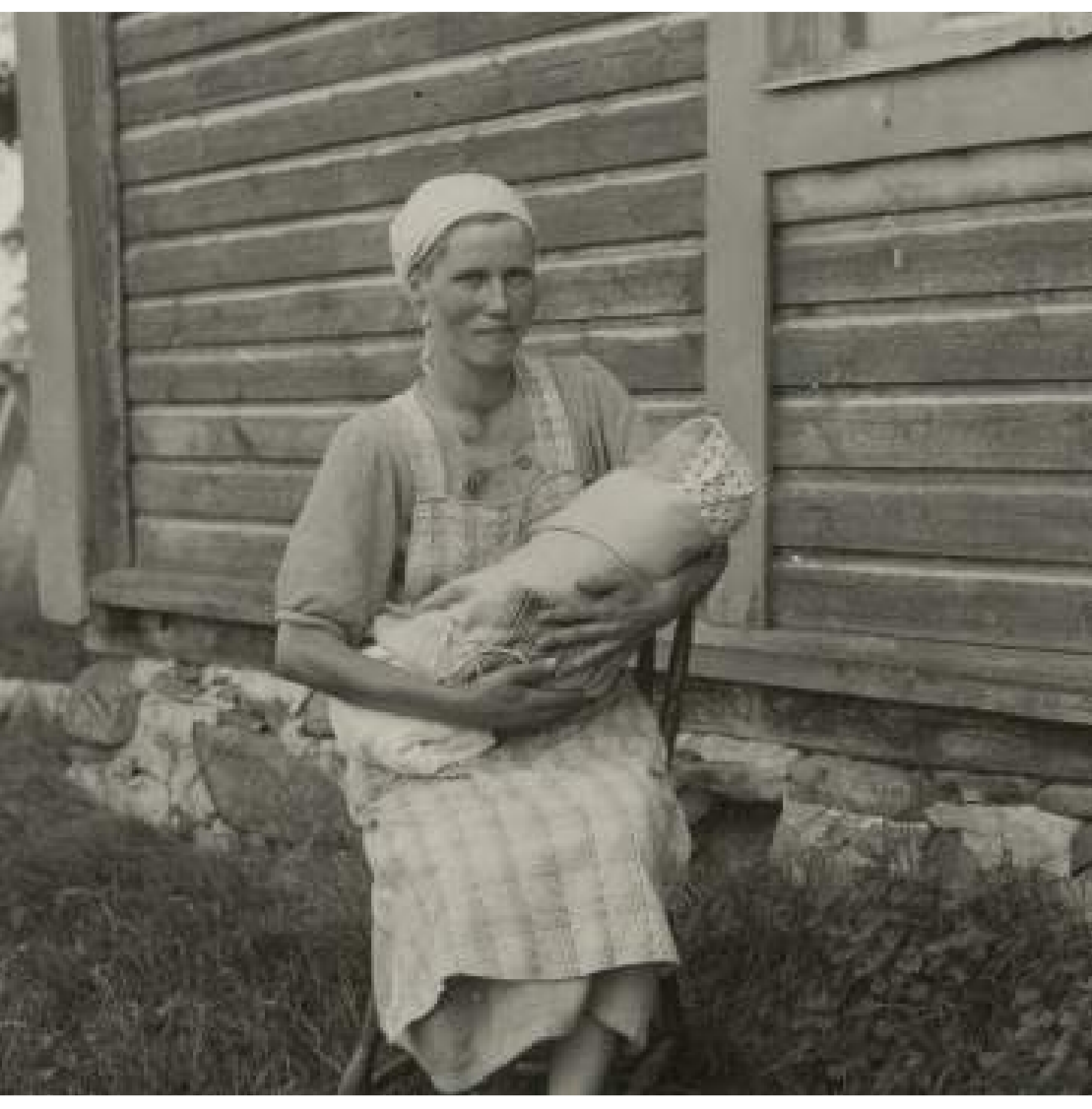
1917 Äiti lapsineen Kuusamon Paanajärvellä, kuvaaja Samuli Paulaharju, Museoviraston kuvakokoelmat, Kansantieteen kuvakokoelma.

1922 Laki avioliiton ulkopuolella syntyneistä lapsista säädettiin.