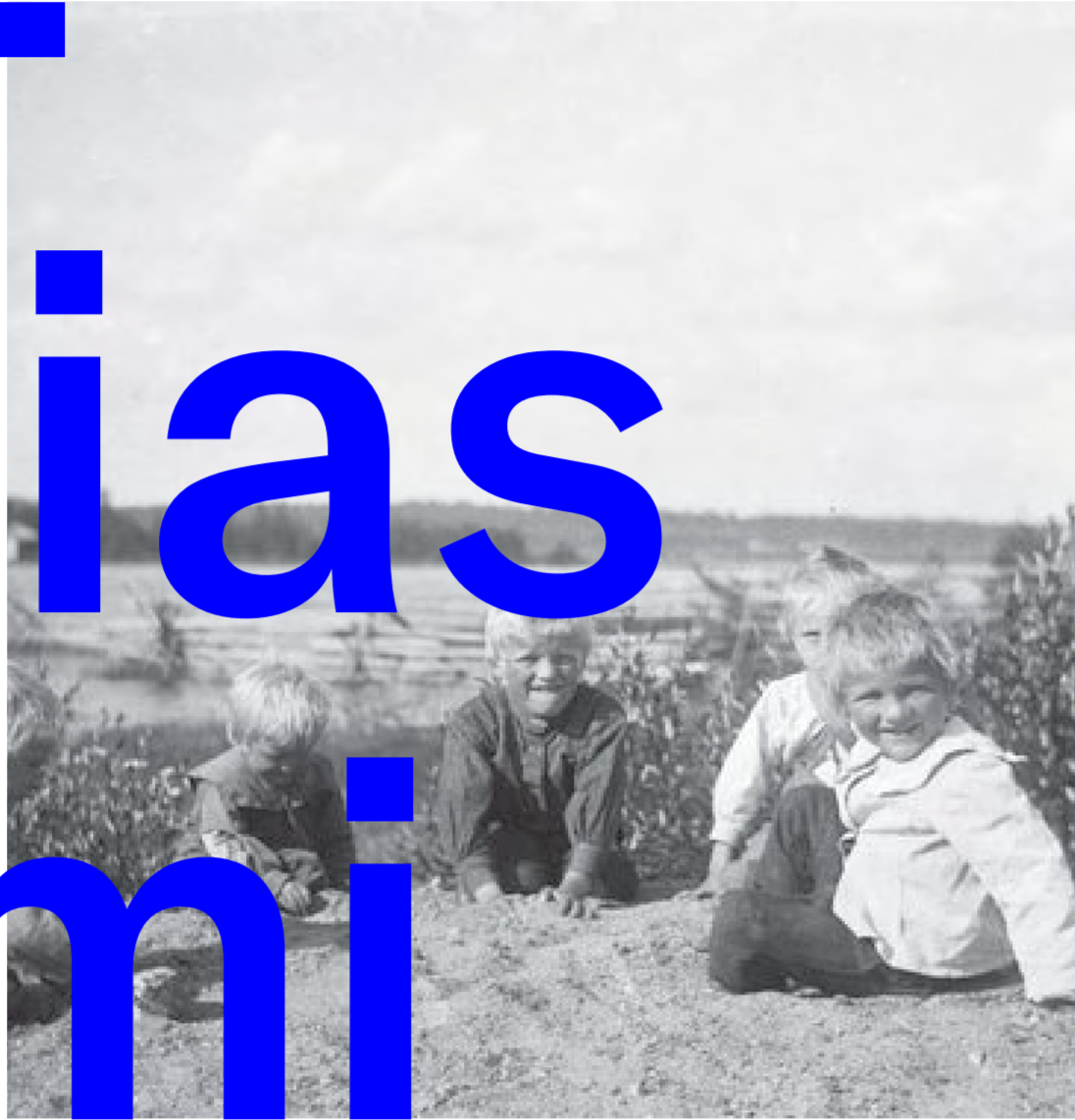
1917 Leikkiviä lapsia, kuvaaja Samuli Paulaharju, Museoviraston kuvakokoelmat, Kansantieteen kuvakokoelma.

1936 Ensimmäinen lastensuojelu- laki tuli voimaan ja kou- lulääkärin virka perustettiin.