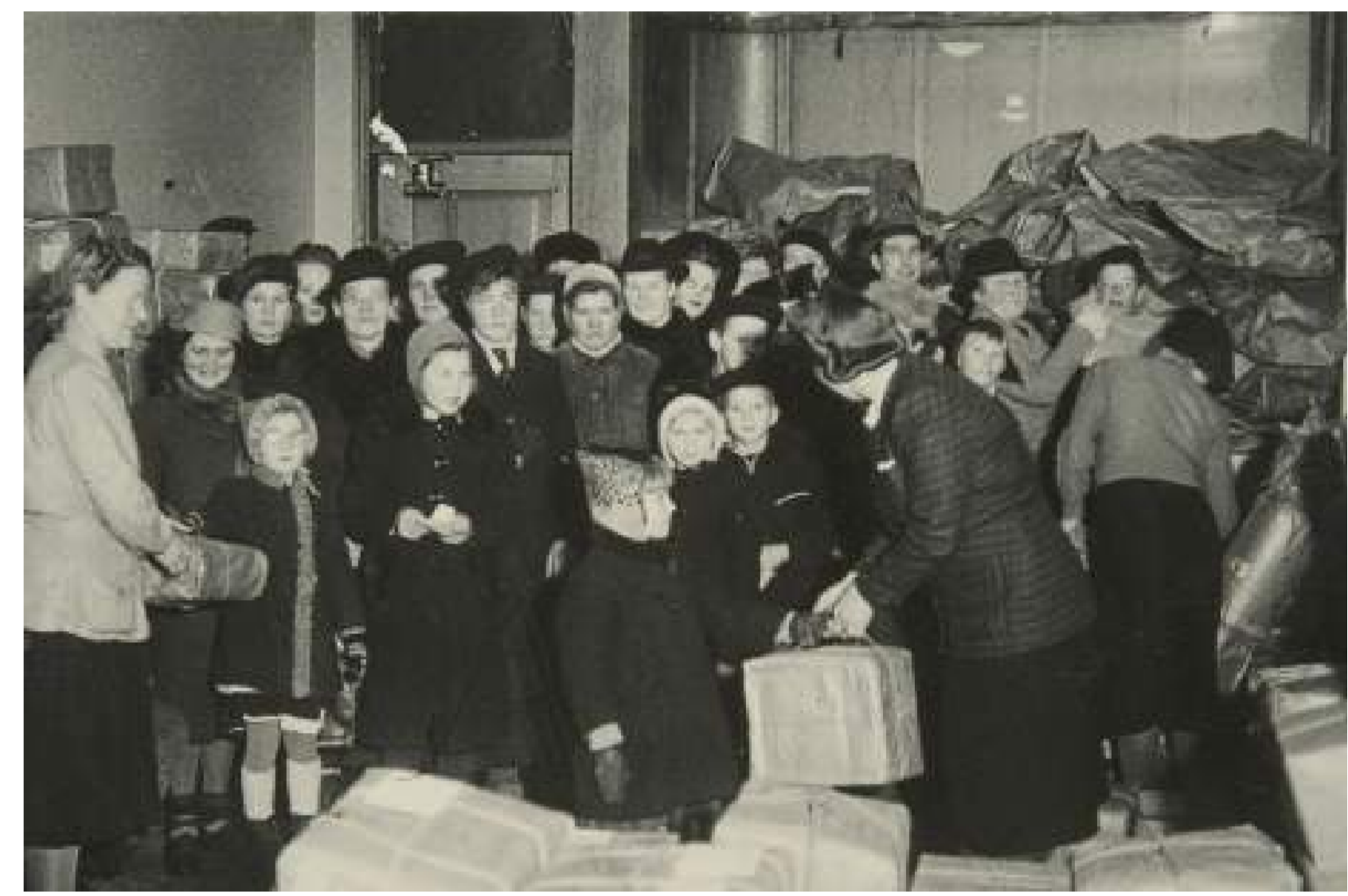
1943 Ruotsalaisten lapsille lähettämiä paketteja vastaanotetaan Turussa, Museoviraston kuvakokoelmat, Historian kuvakokoelma.

1949 Äitiysavustus tuli kaikkien äitien saatavaksi ja säädet- tiin laki, jonka mukaan jokaisessa kunnassa tulee olla neuvola.