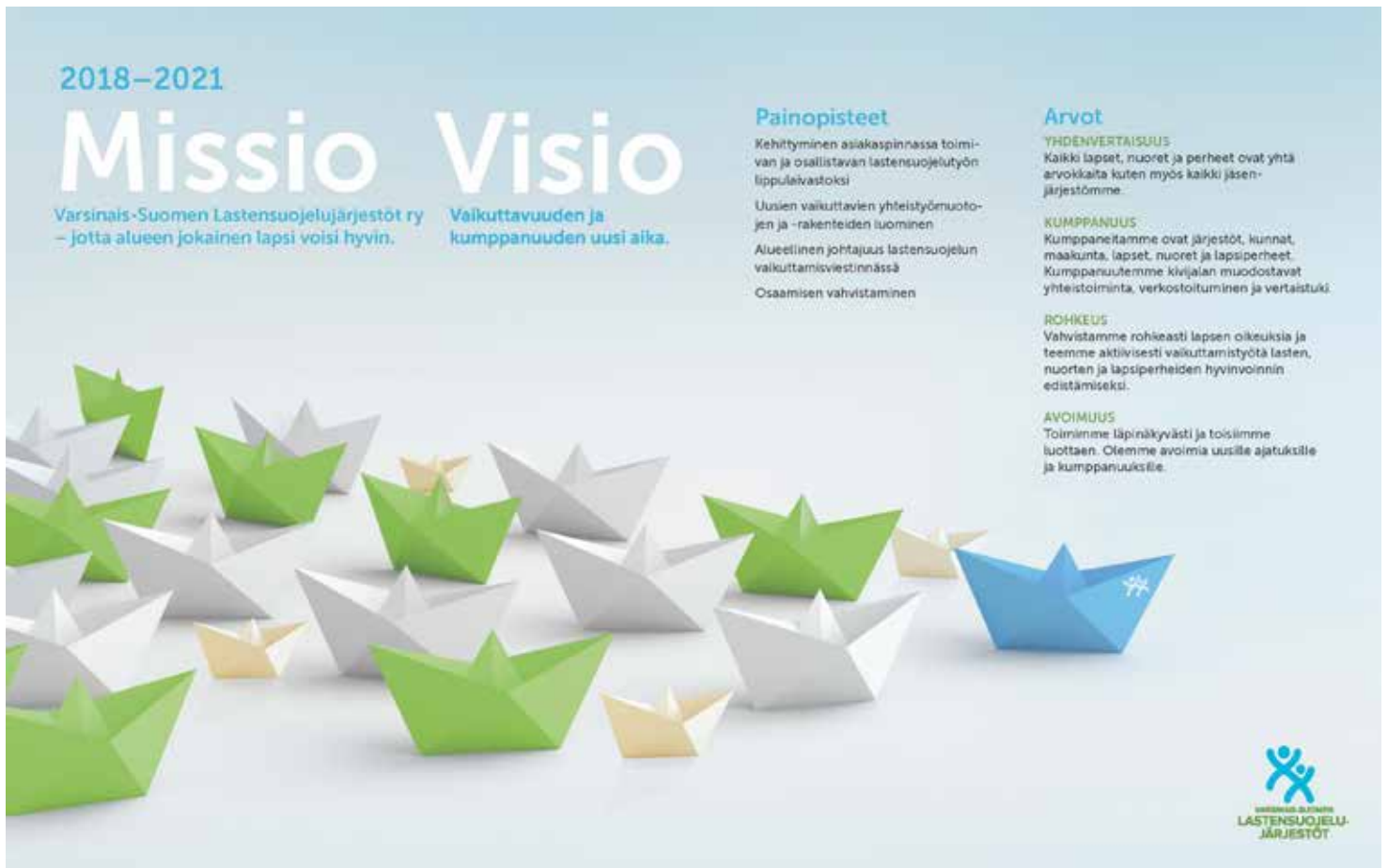
Kuvio: Strategiset painopisteet vuosina 2018-2021.

1) Kehittyminen asiakaspinnassa toimivan ja osallistavan lastensuojelun lippulaivastoksi -painopisteellä pyritään saamaan lastensuojelujärjestöjen toiminta jalkautumaan sekä lisäämään lasten, nuorten ja lapsiperheiden osallisuutta. 2) Uusien yhteistyömuotojen ja rakenteiden luomisella tavoitellaan mahdollisimman vaikuttavaa ja resurssiviisasta toimintarakennetta- ja tapaa tehdä yhdessä niin lastensuojelujärjestöjen kesken kuin muiden kumppaneiden kanssa. 3) Alueellisella johtajuudella lastensuojelun vaikuttamisviestinnässä tavoitellaan lastensuojelujärjestöjen yhteisen äänen ja tiedon sekä lasten, nuorten ja lapsiperheiden näkökulmien voimistumista. 4) Osaamisen vahvistamisella pyritään tukemaan niin lastensuojeluyhdistysten muutosvalmiutta kuin lastensuojeluun liittyvän osaamisen lisäämistä.